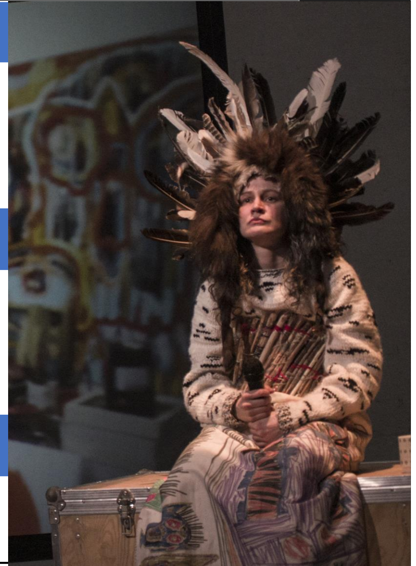
Představení Skugga Baldur, Studio Hrdinů