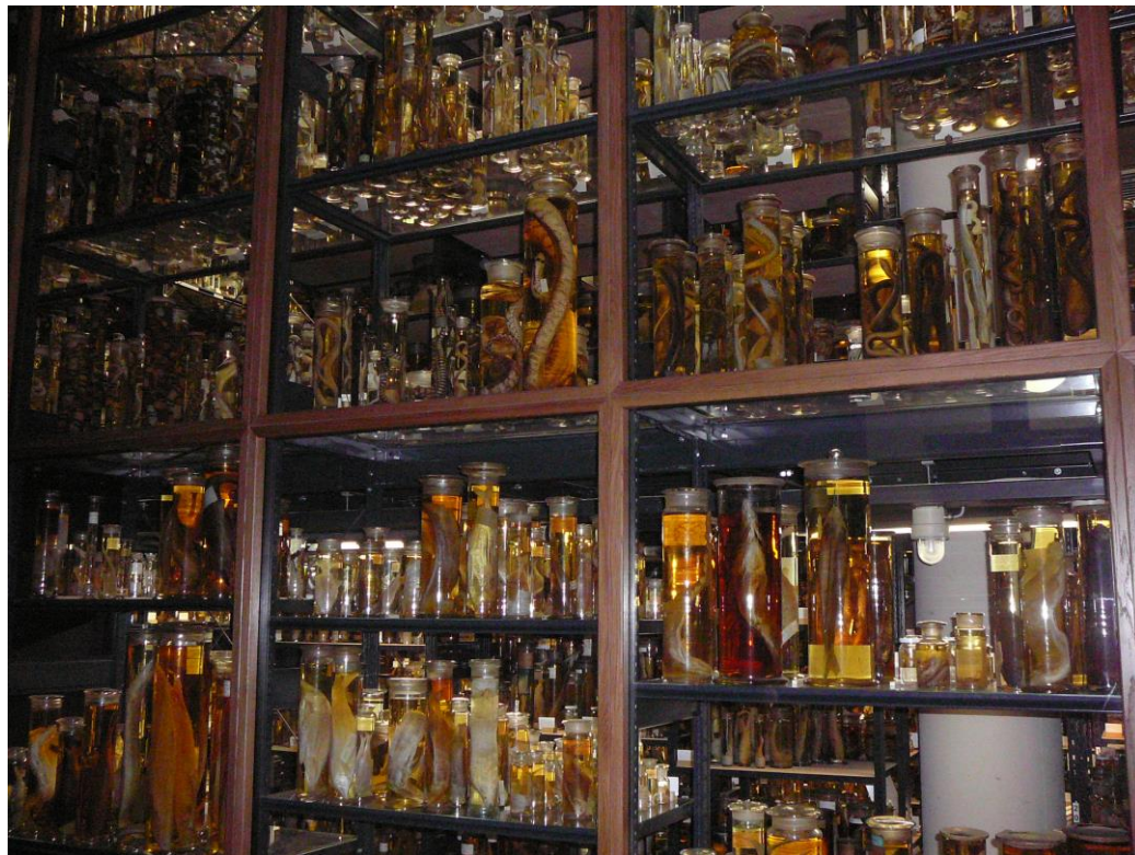
Foto: Studijní cesta na konferenci Global Genome Biodiversity Network (GGBN) spojená s bilaterálním setkáním s norským partnerem (Berlín, genetická banka živočichů)