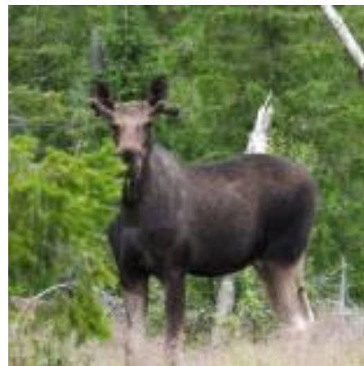
Foto: Pokračování bilaterální spolupráce ve výzkumu smrkových porostů ve středním Norsku (COOP), Mendelova univerzita v Brně